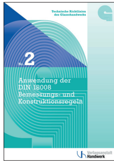
TR Nr. 2 Anwendung der DIN 18008 Bemessungs- und Konstruktionsregeln 49,- Euro

Es sind zwei neue Richtlinien erschienen, die für das Planen und Bauen mit Glas eine wertvolle Hilfe sind.