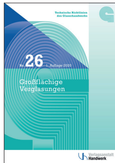
TR Nr. 26 Broschüre Großflächige Verglasungen 19,80 Euro